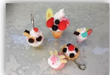
ทำตัวอย่างอาหาร

☆ ในทุกเทอมจะมีกิจกรรมพิเศษนอกเวลาเรียน เป็นตัวเลือกให้นักเรียน