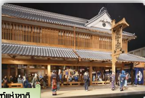
พิพิธภัณฑ์แห่งชาติ Edo-Tokyo