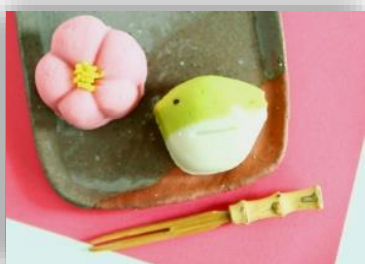
ทำขนมญี่ปุ่น